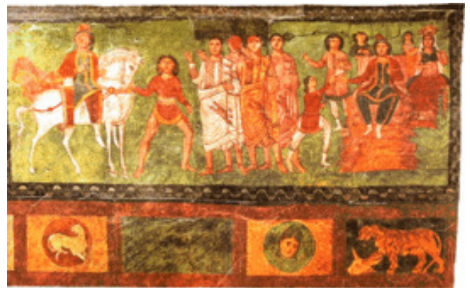
איור מקיר בית הכנסת דורה אירופוס על הפרת: המן מוליך את מרדכי הרוכב על סוס המלך

"קיימו וקבלו (וקבלו) היהודים עליהם ועל-זרעם ועל כל-הנזקים עליהם, ולא יעבור--להיות עושים את שני הימים האלה ככתבם וכזמנם בכל-שנה ושנה: והימים האלה נזכרים ונעשים בכל-דור ודור, משפחה ומשפחה, מדינה ומדינה ועיר ועיר; וימי הפורים האלה לא יעברו מתוך היהודים, ויזכרום לא-יסוף מזרעם:"